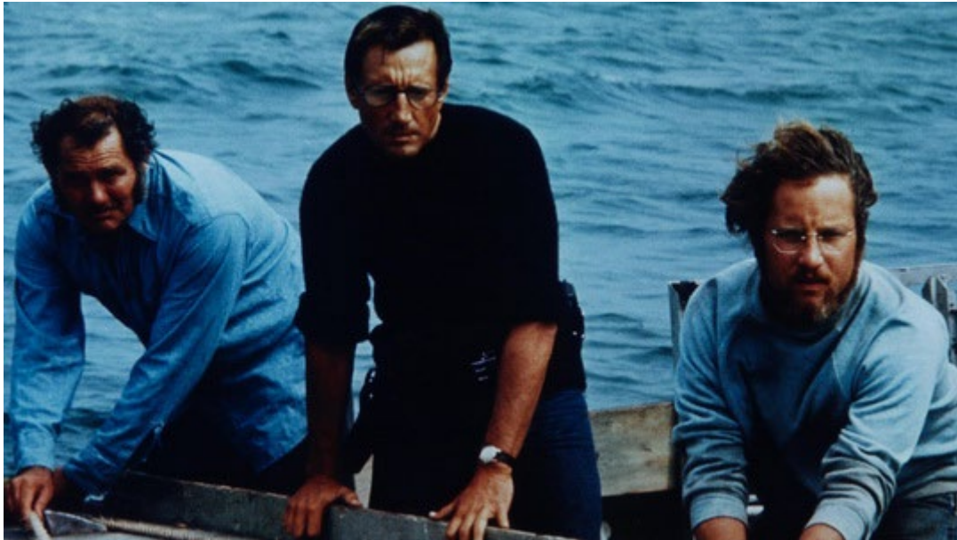
Quint, Sherrif Brody en Hooper op zoek naar de haai in Jaws