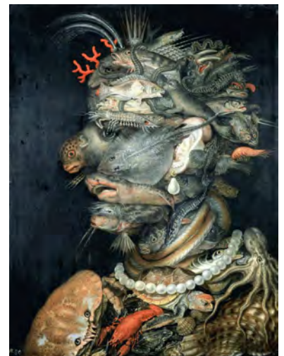
G. Arcimboldo - Water

KHM bevat (mede) de collectie schilderijen en kunstvoorwerpen, welke de Habsburgse monarchie in de loop der eeuwen verzameld heeft. KHM heeft zelf diverse Arcimboldo's. Hij (Giuseppe Arcimboldo (1527-1593)) heeft 25 jaar aan het Habsburgse Hof gewerkt en zeker niet alleen als hofschilder. In 2008 heeft KHM een speciale overzichtstentoonstelling aan hem gewijd, waarin naast de in de film getoonde foto's m.b.t. DVE, ook schilderijen van hem getoond werden van enerzijds zijn "normale" schilderwerk en anderzijds allegorische voorstellingen van b.v. de vier seizoenen. De kunststroming, waartoe een aantal werken van hem w.o. DVE gerekend mogen worden, heet "maniërisme", welke gekenmerkt wordt door veel expressie en dramatiek in compositie, schilderijstijl en kleurgebruik. Daarnaast waren overdrijving en afbeelding van vervormde lichaamsdelen dan wel ledematen hiervan een onderdeel. Deze kunststroming is maar een kort leven beschoren geweest. Tegenwoordig spreekt deze stijl meer aan. KHM heeft zelf maar twee van de vier schilderijen (op hout) van DVE nl. water en vuur (1566).