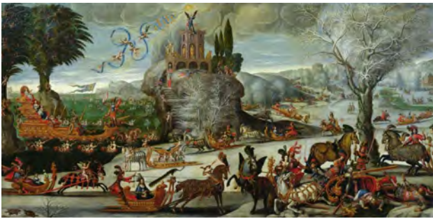
Claude Déruet - Water

compositie en uitdrukking vallen de doeken Water en Vuur het meeste op. Water wordt weergegeven als ijs, waarop de Franse koning – Lodewijk XIII - op de voorgrond op een slee voorbij gaat, terwijl Vuur weergegeven wordt als vreugdevuur/vuurwerk voor de Franse koning. Op het doek Aarde wordt gevierd de geboorte van de kroonprins van Lodewijk XIII in 1638. Van de 4 schilderijen is alleen Vuur gesigneerd door Claude Déruet. De Franse koning(in) komen op drie van de vier schilderijen voor.