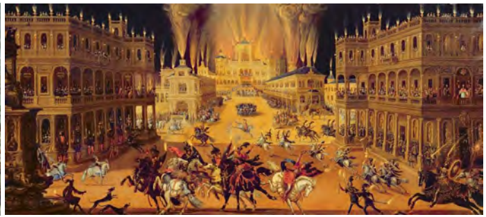
Claude Déruet - Vuur