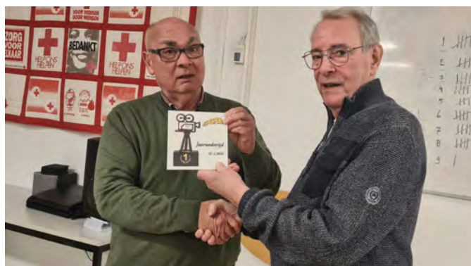
1 e prijs

Nog even de certificaten uitdelen en de avond is voorbij. Volgende week weer nieuwe kansen.