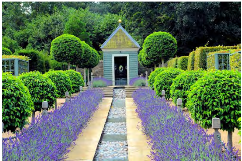
Garden of surprises

Een goed voorbeeld is de villa van keizer Hadrianus Villa d'Este in Tivoli- Italië. Tegen deze achtergrond is de uitbeelding van DVE geen verrassende invulling. Overigens bevatte ook de collectie van Burghley House schilderijen uitbeeldende DVE door Breughel - in dit geval uit de Breughel studio. Deze schilderijen, die zij al sinds 1688 in haar bezit had, hebben nagenoeg dezelfde setting (grootte en uitbeelding als die van Kingston Lacy), maar wel op doek.