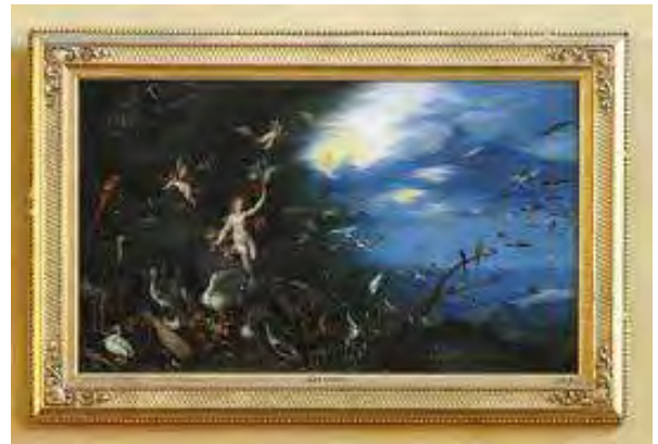
Kingston Lacy - Lucht

De vier schilderijen in Kingston Lacy, sinds 1981 eigendom van de National Trust, zijn 47,6 x 82,5 cm groot en geschilderd in de periode 1625-1632 door Jan Breughel Jr (1601-1678) op koper en in samenwerking met Hendrik van Balen (1575-1632). De samenwerking bestond uit het volgende: de een schilderde de natuur en/of dieren, de ander de personen.