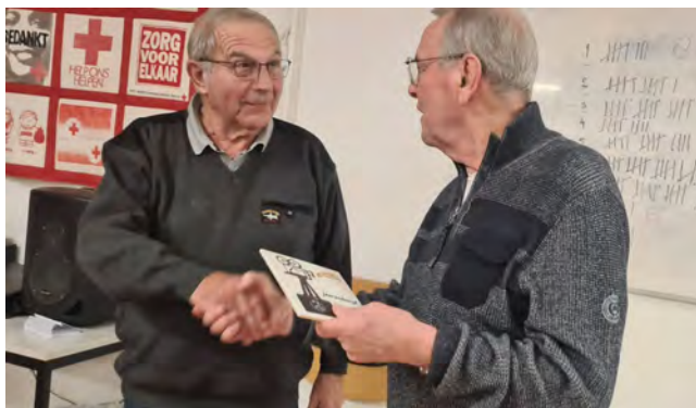
2 e prijs