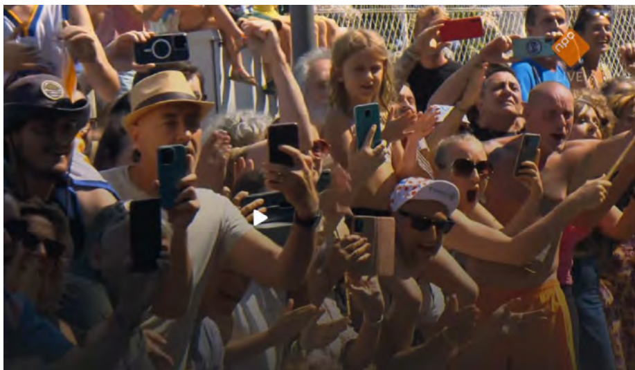
De "toekomst" in beeld gebracht tijdens een etappe van de laatste Tour de France

De camcorder is in het midden- en topsegment nog lang niet dood. Springlevend zelfs met alle waar naar zijn geld. In de Digital Movie van deze maand (152-2023) worden drie camcorders besproken, die voor hetzelfde geld betere AV-kwaliteiten bieden met betrekking tot het zoomen, scherpstellen, beeldstabiliteit, handligging en opslagcapaciteit.